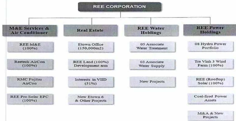
Sơ đồ 2

Hội đồng Quản trị trình Đại hội đồng Cổ đông thông qua chủ trương tái cấu trúc và chuyển dịch tài sản từ REE Corporation sang các công ty Holdings theo từng ngành riêng biệt và ủy quyền cho Hội đồng quản trị triển khai việc tái cấu trúc hoạt động kinh doanh theo lộ trình thời gian phù hợp.